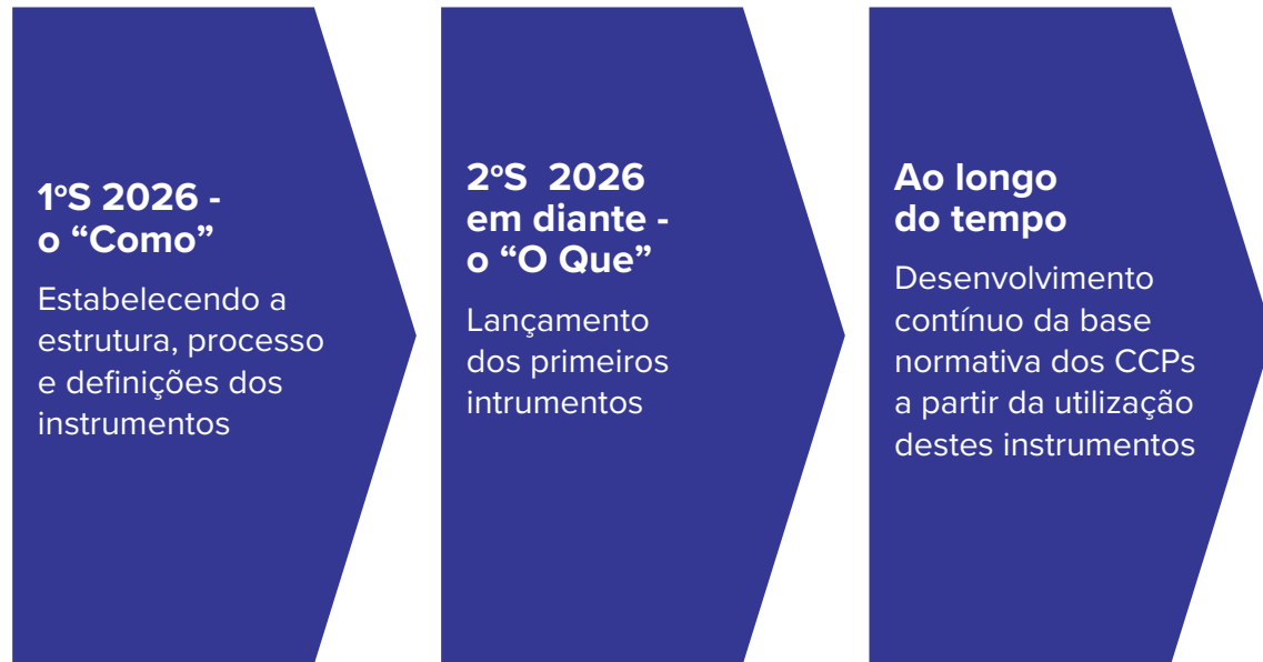
Diagrama 1: Uma abordagem por fases

Consulte o Diagrama 1 para uma visão simplificada desta abordagem em fases.