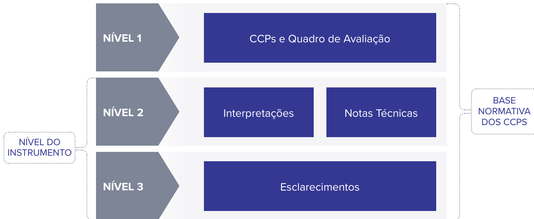
Diagrama 2. Estrutura da base normativa dos CCPs

O Diagrama 2 mostra como a base normativa dos CCPs está estruturada, incluindo a relação entre os níveis de instrumentos que apoiam a utilização dos Princípios Fundamentais do Carbono e do Quadro de Avaliação na prática.